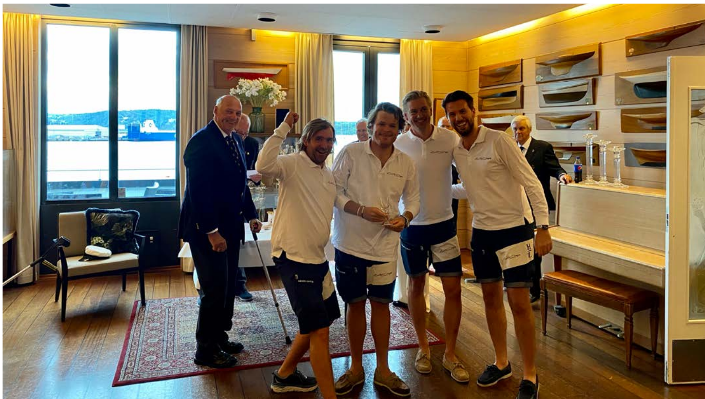
H.M. KONGEN delte ut premier på Kongens Serieseilaser. Her med Team "Still Crazy" som tok 2. plass i J/70 klassen.