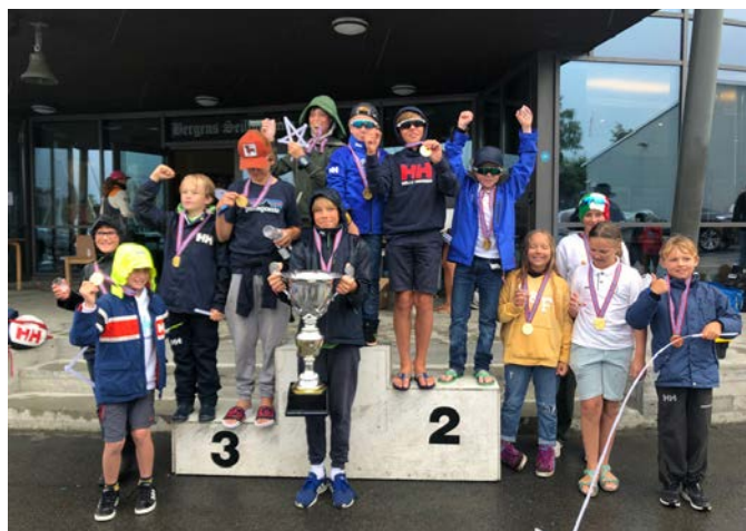
KNS SEILERNE på NM i Bergen.