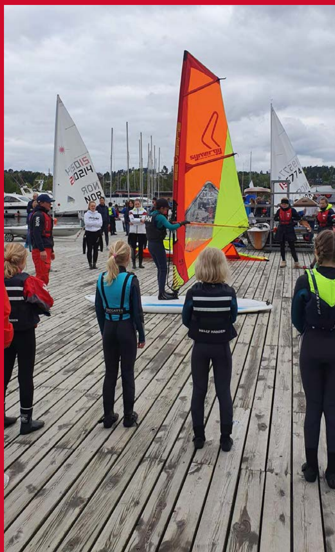
OPPSTARTSHELG for brettseilerne.