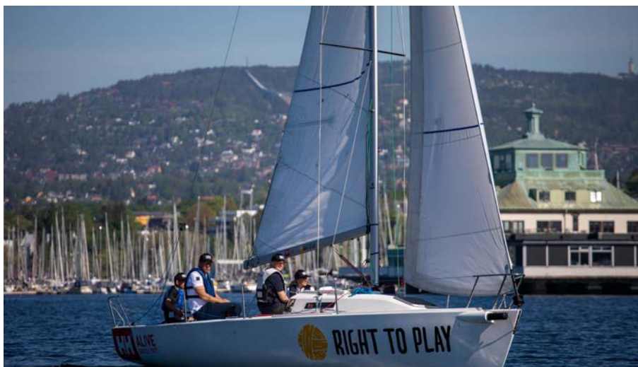
I 2021 GIKK KNS, Right to Play og Helly Hansen sammen og døpte den ene J/80 båten til "Lek på havet".