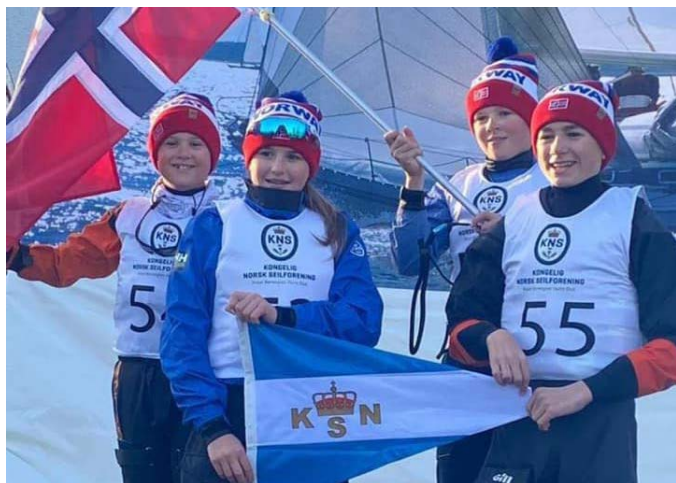
TEAM KNS I BERLIN for å seile Optimist Team Cup.

Vi har mange unge seilere i vår gruppe med mange år igjen i optimisten, så vi gleder oss stort til neste sesong.