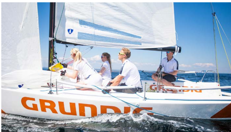
EN AV BOATPOOL BÅTENE i aksjon under Grundig Hankø Race Week.

Det ble også bestilt en ny J/80 som kommer neste sesong.