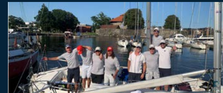
HELLY HANSEN Lagene tok 1. & 2. plass i Express NM.