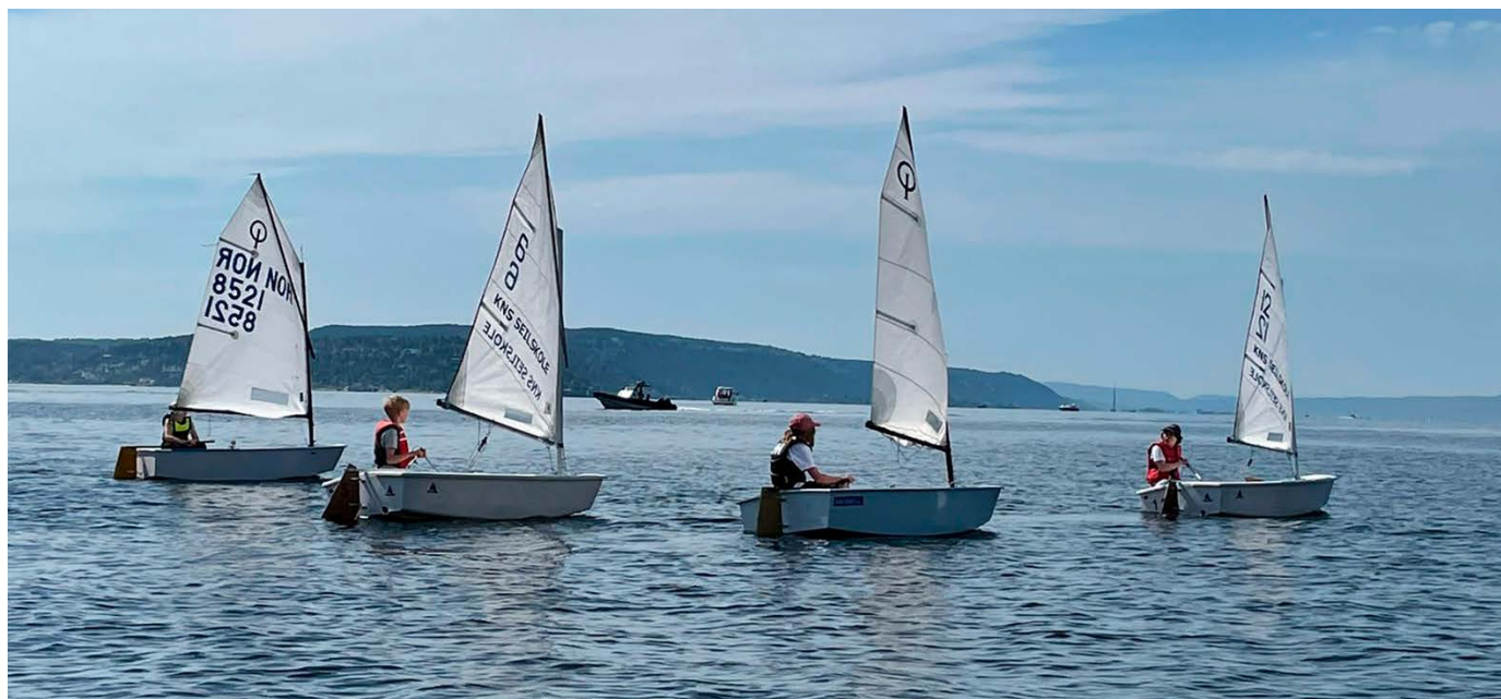
VK GRUPPEN på tur til Vassholmen.