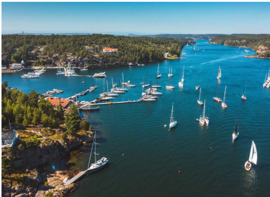
DEN NYE BRYGGEN på Hankø Yacht Club.