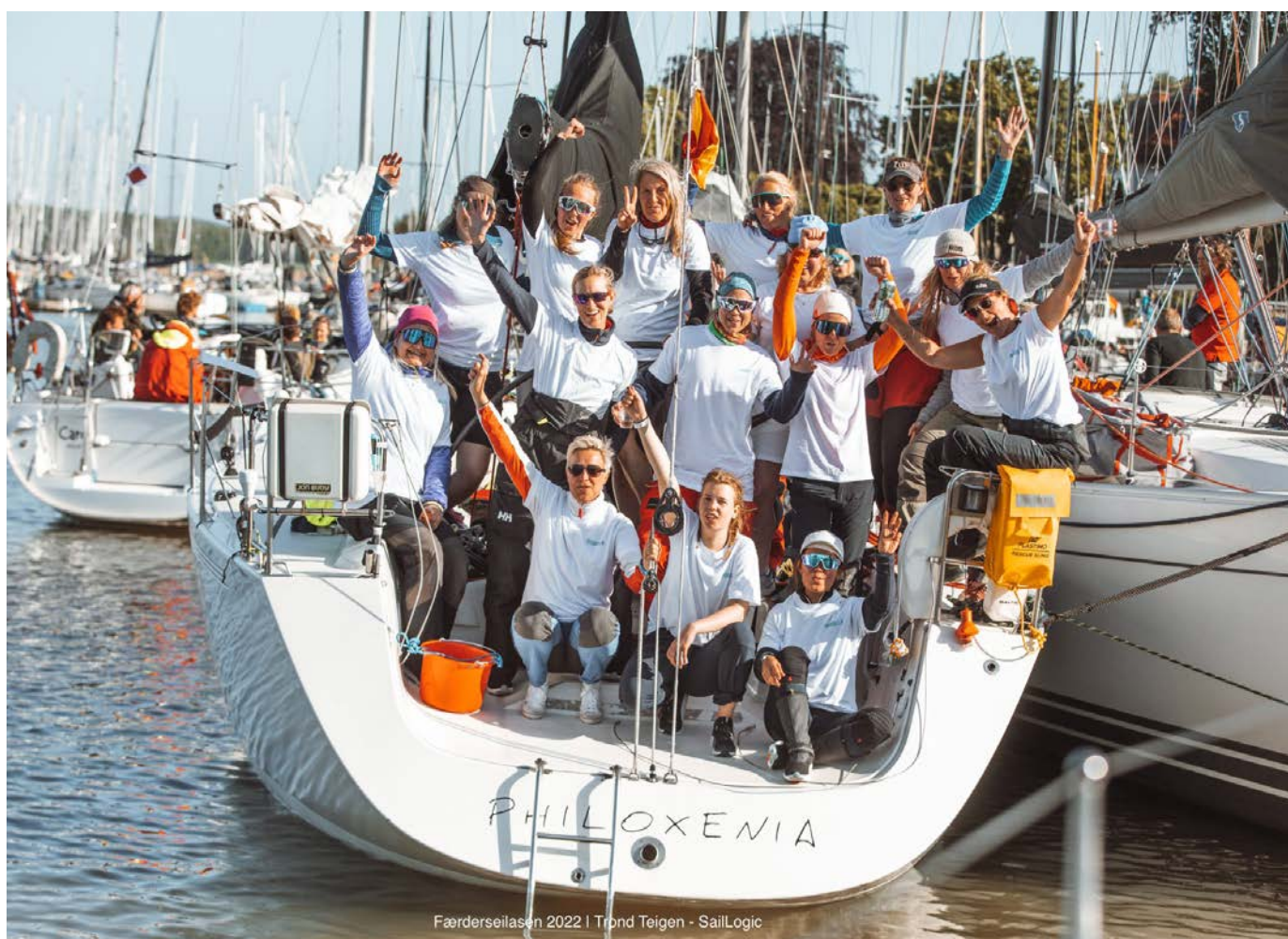
TEAM REBELLA etter Færderseilasen.

*** 145 trenerplagg er laget av økologisk bomull, de resterende 55 er i teknisk materialet UV faktor 50+ og sertifiserte bluesign® tekstilsertifisering.