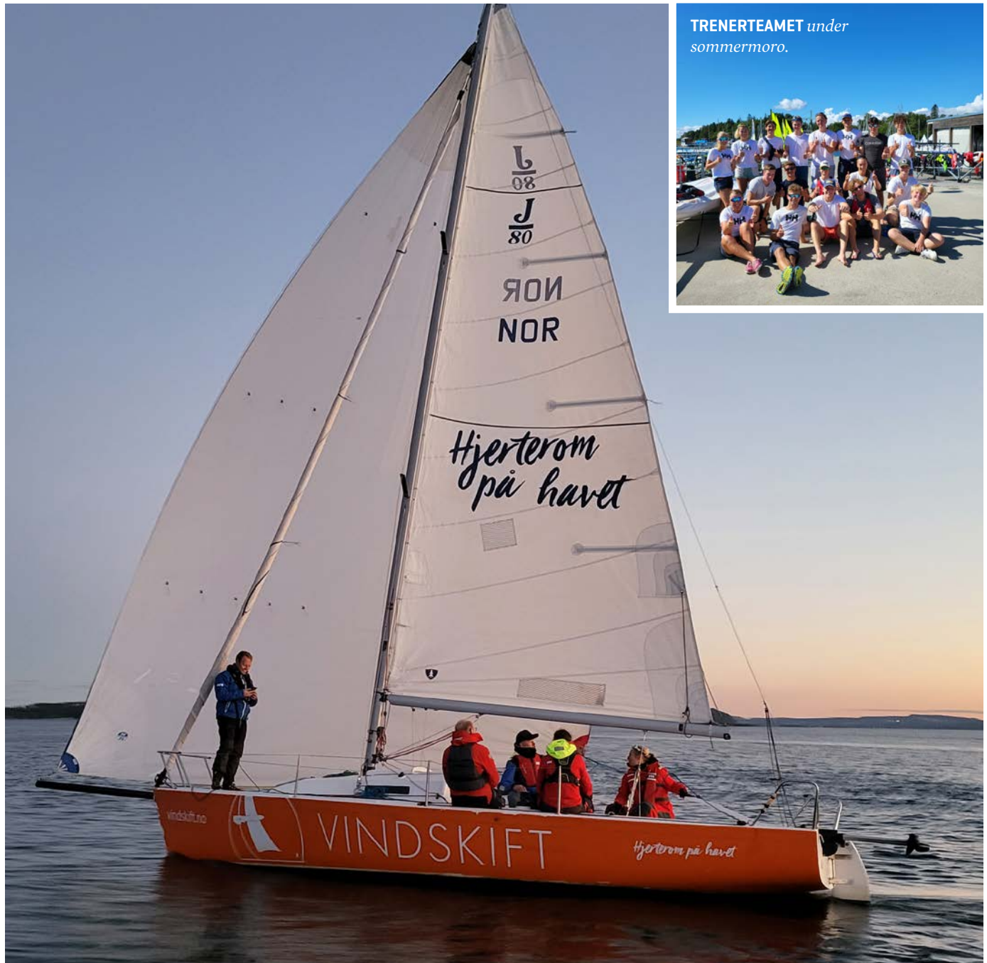
TRENERTEAMET under sommermoro.

gang med å designe nye biber (vester) sammen med KNS.