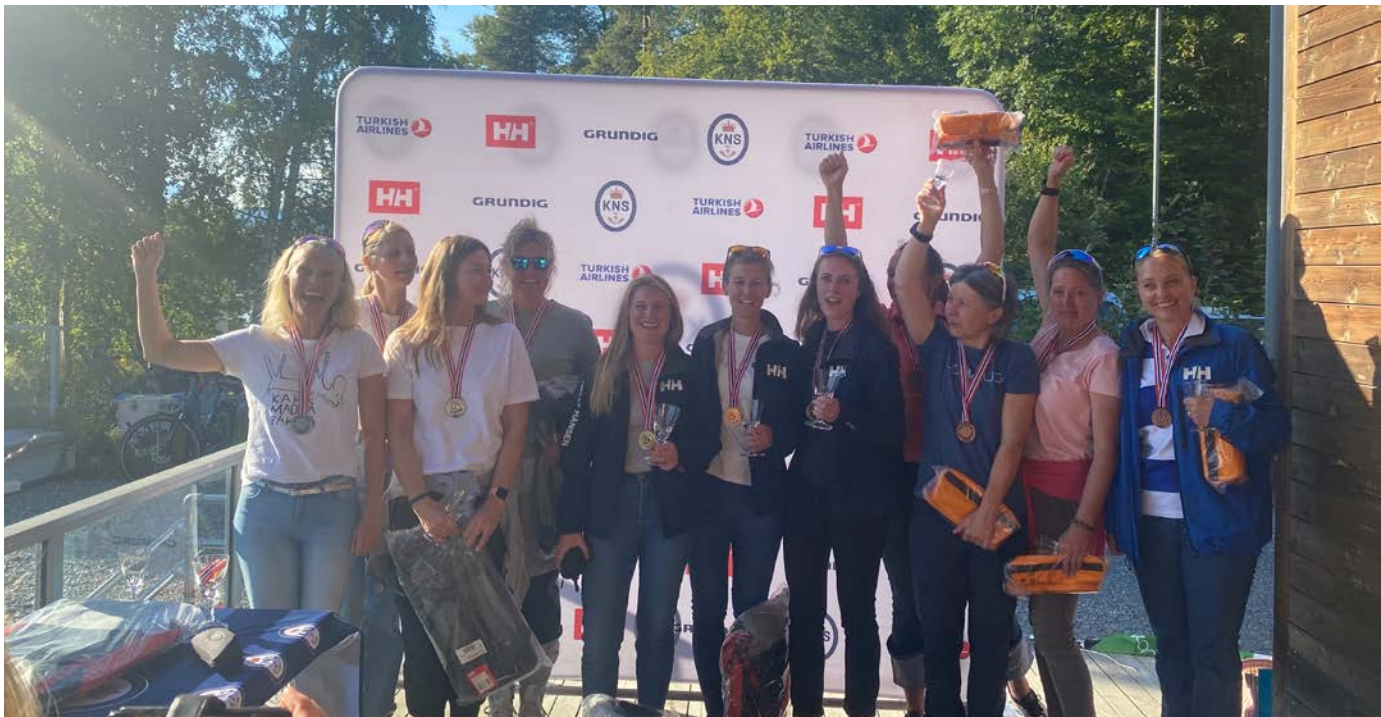
VINNERNE AV DAME NM.