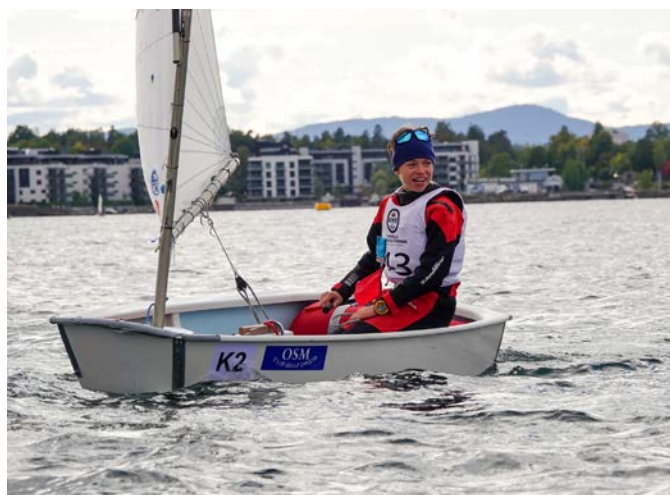
KNS' FØRSTE LAG VANT LAGCUPEN , og fikk dermed representere Norge under Opti Team Cup i Berlin.