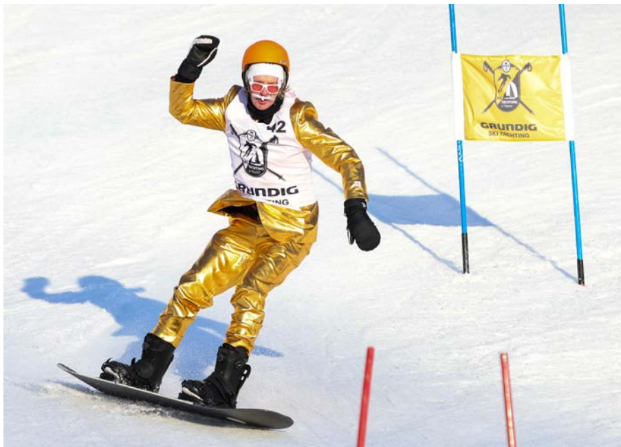
FRA SKIBAKKEN UNDER SKI YACHTINGEN , det er premie for beste kostyme.

og ønsker å prøve dette for første gang. Her er det trenere som arrangerer og følger opp barna hele helgen slik at seilerne får en fin introduksjon til