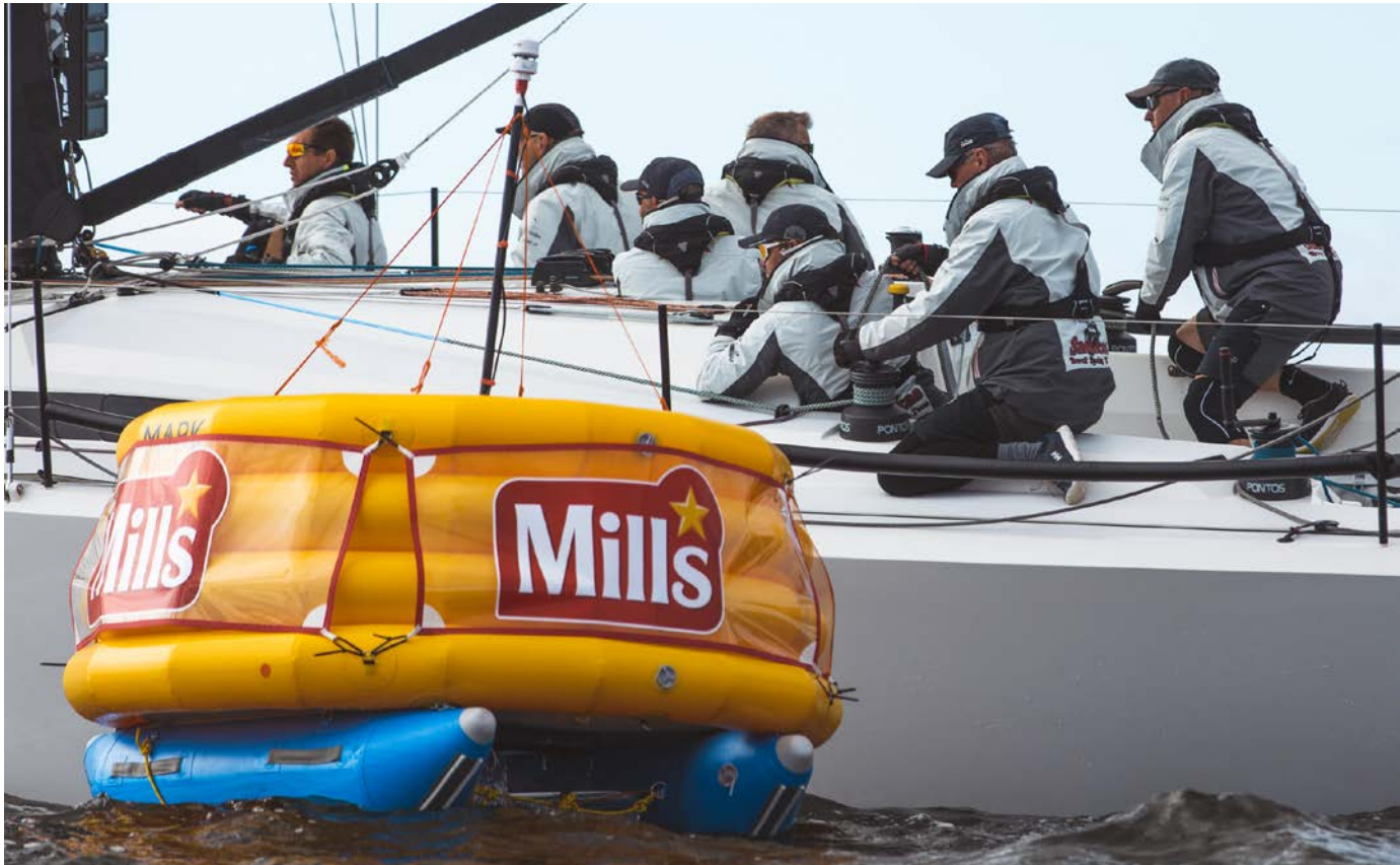
EN AV DE NYE ROBOTBØYENE under ORCi EM på Hankø.