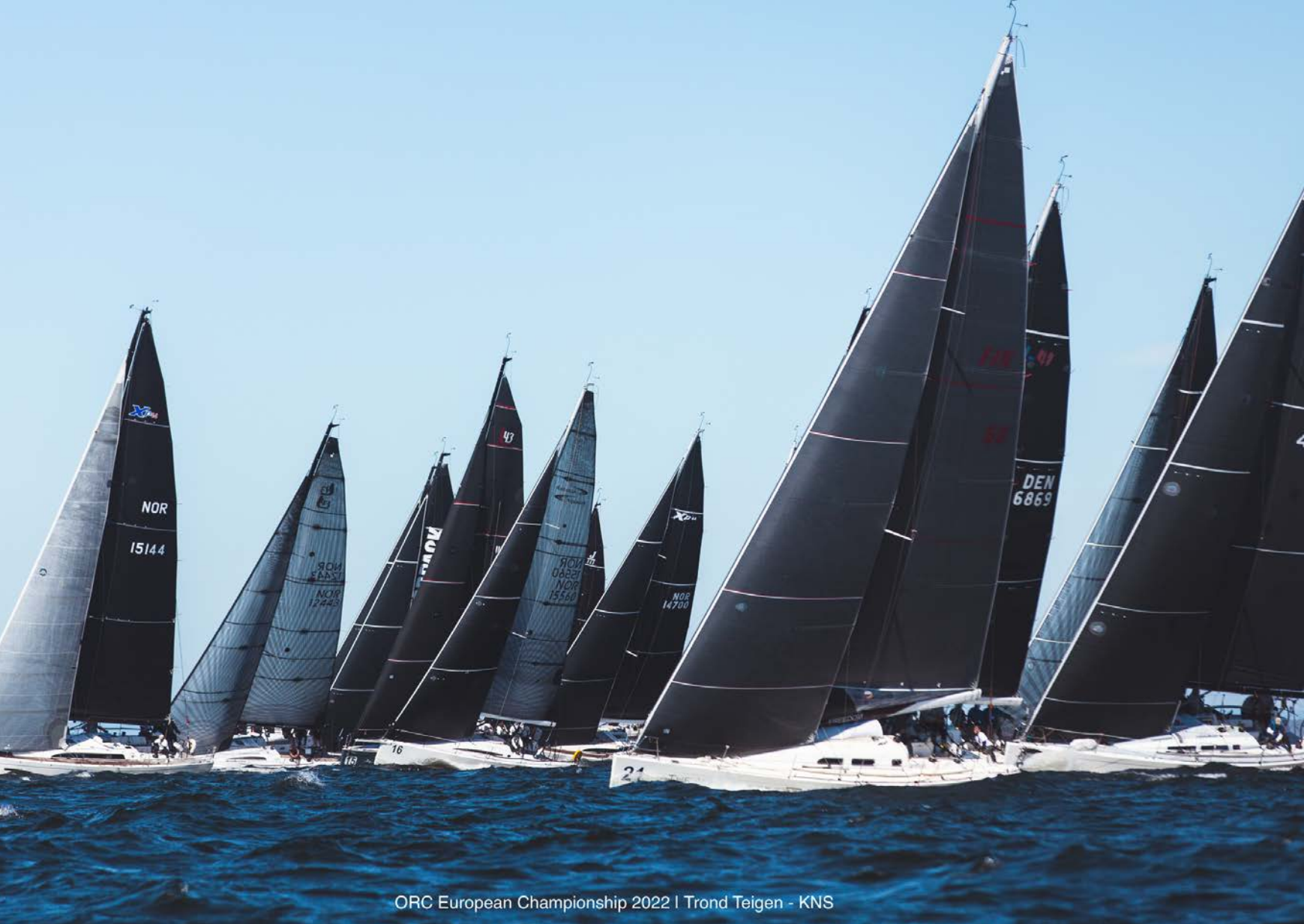
ORC European Championship 2022 | Trond Teigen - KNS