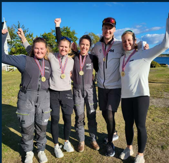
TEAM GODE VIBBER vant J/70 NM.