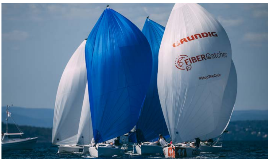
GRUNDIG HANKØ RACE WEEK.