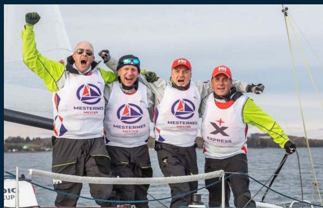
VINNERNE av Mesternes Mester.