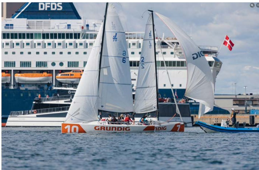
GRUNDIG WOMEN'S REGATTA.

regattaen. Foreningen forsvarte dermed tittelen, siden de også vant fjorårets lagcup. Den store gulroten for vinnerlaget var å reise til Opti Team Cup i Berlin for å representere Norge. Andreplassen gikk til Tønsberg Seilforening, mens tredjeplassen gikk til Arendal Seilforening.